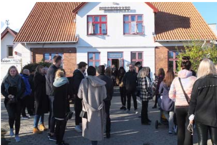
Studerende på besøg på Borgbygård

Det viste sig at børnene havde meget fornøjelse og læring af at være sammen med forskellige aldre. Samtidig skulle de ikke have de mange