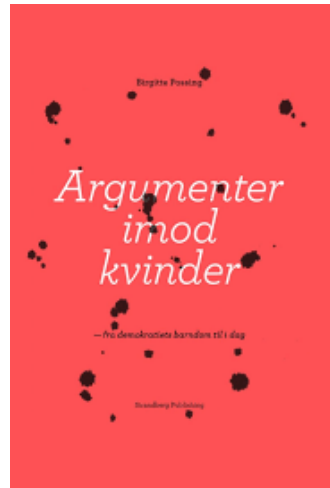
Argumenter imod kvinder Birgitte Possing, Strandbergs forlag 2018

I argumentationen for den bestående "orden" er det selvfølgelig fremført, at kvinder har andre, særlige styrkeområder og egenskaber, der kvalificerer dem til især omsorgsfunktioner i forbindelse med reproduktionen af familien, vedligeholdelse af arbejdsstyrken og opdragel-