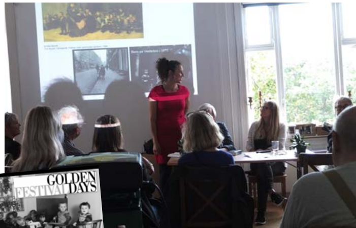
Møde på Borgbygård