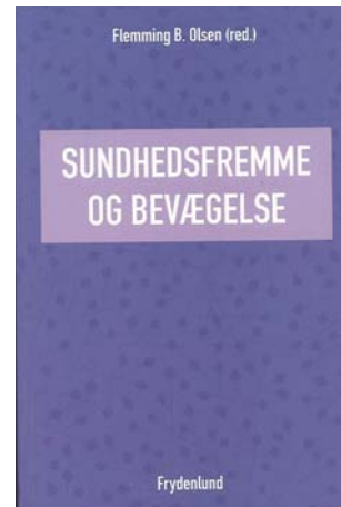
Sundhedsfremme og Bevægelse 273 sider, redigeret af Flemming B. Olsen, Frydenlund 2018.

Hygiejne standardens betydning for, at der opstår, eller ikke forekommer sygdom: pladsforhold, indeklima og antallet af børn.