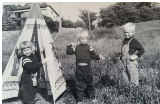
Glade børn på koloni i 70-erne

Studiekredsens næste emne er planlagt til: “Kolonien er væk, hvilken betydning har det?” Næsten ingen børnehaver tager på koloni mere. Engang tog næsten alle af sted. Snart er de gamle pædagoger væk, tiden må være inde til at samle op på betydningen af kolonierne. Relationer udvikledes, bånd blev styrket, børn oplevede at kunne klare at være hjemme- fra, forhindringer blev klaret sammen.